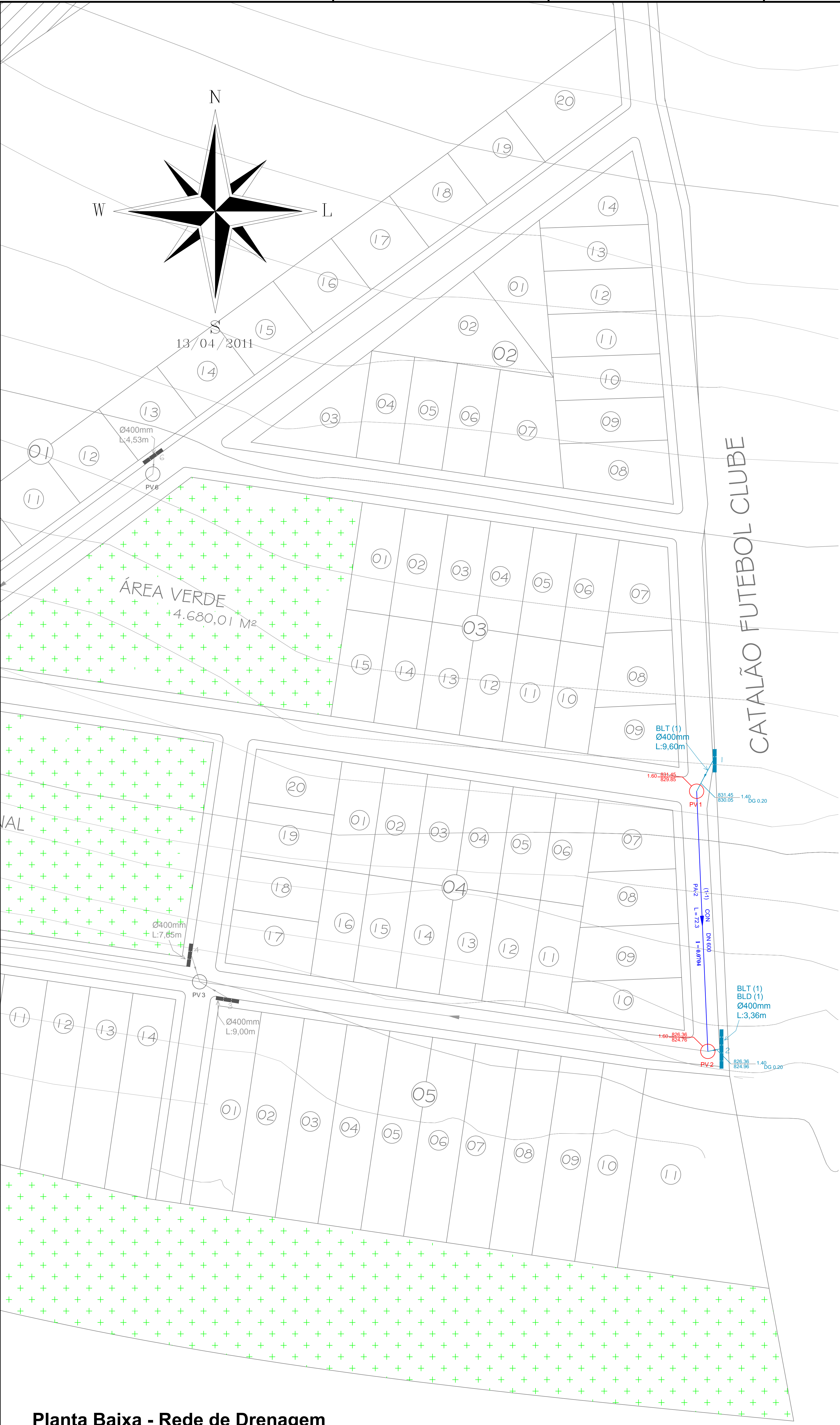
Planta Baixa - Rede de Drenagem Escala: 1:500